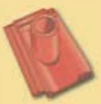
Grundpfanne 10 cm