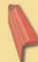
Ortgangplatten gerade A