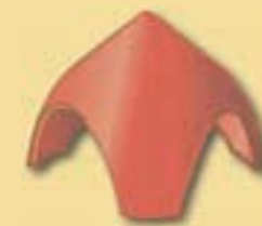
Walmkappe 3er A