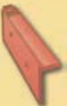
Grundpfanne 10 cm