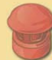
Dunstrohr 10 cm