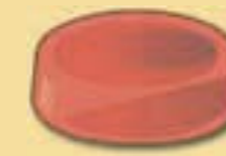
Dunsthut 10 cm