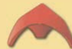
Walmkappe 3er B