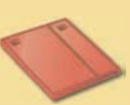
1 1/2 Ziegel