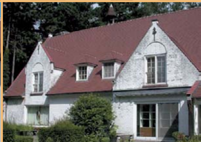
Sablé Champagne Rouge flammé Brun Sablé Bourgogne