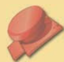
Grundpfanne 15 cm