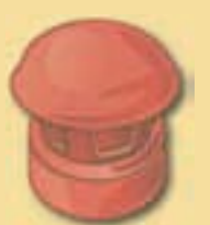
Dunstrohr 10 cm