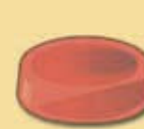
Dunsthut 10 cm