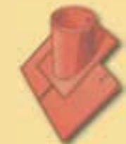
Grundpfanne 10 cm