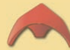
Walmkappe 3er B