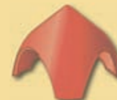
Walmkappe 3er A