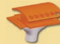
Grundpfanne 10 cm