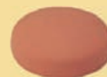
Dunsthut 13 cm