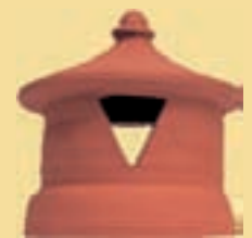
Dunstrohr 13 cm