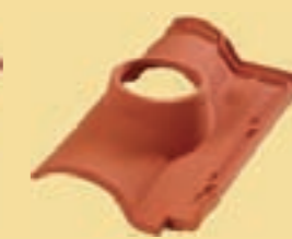
Grundpfanne 13 cm