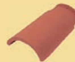
1/2 Ziegel B