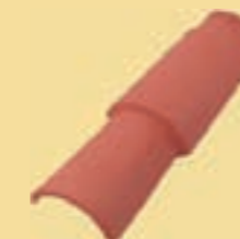
1/2 Ziegel A