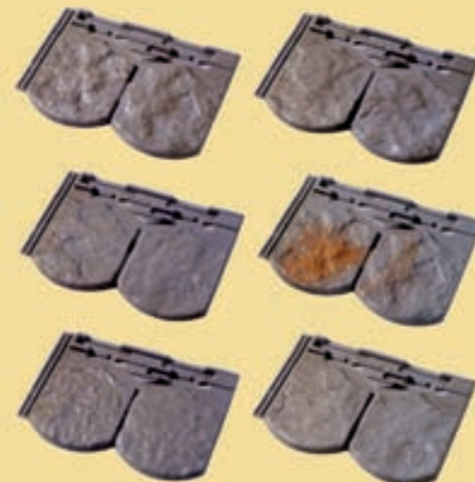
Insgesamt 24 unterschiedliche Strukturen