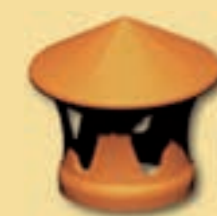
Dunsthut 10 cm