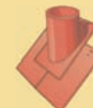
Grundpfanne 10 cm