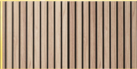
9. Lamellenwand Natur