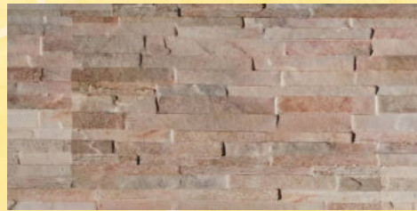
7. Schieferwand Creme