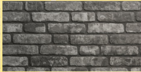
6. Ziegelwand Anthrazit