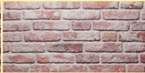
2. Ziegelwand Rot-Weiss