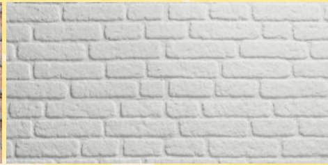
5. Ziegelwand Weiss