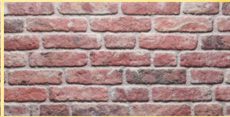
3. Ziegelwand Rot