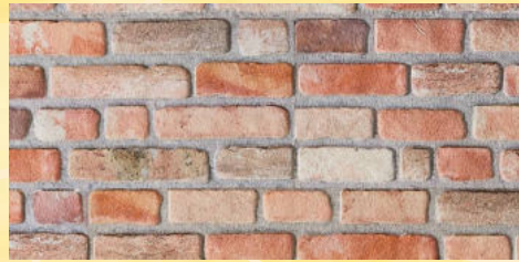
4. Ziegelwand Rustikal