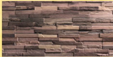
1. Schieferwand Teak